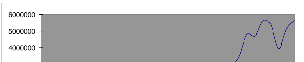
Figura 1. Comportamiento de las Exportaciones de Colombia en la CAN

Al inicio de los noventas (90's) la apertura económica trajo consigo problemas para la economía colombiana que no estaba preparada para un cambio tan radical, la apertura no se hizo de manera gradual, faltó mucha capacitación para mejorar los procesos productivos y en general Colombia no poseía ventajas competitivas fuertes con relación al resto del mundo, esta desigualdad en las condiciones comerciales llevaron a Colombia a una de sus mayores crisis industriales, pero a pesar de lo anterior se registra un aumento en las exportaciones en un 20% debido a que la apertura amplió la posibilidad de comercializar y las nuevas rutas permitieron que este incremento se diera, pero sólo hasta principios de 1998, en donde sufrieron una notoria caída por causa de la crisis económica que vivió el país y por el fenómeno del NIÑO que afectaron todos los sectores económicos de Colombia.